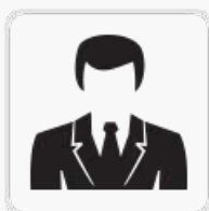
Segnini Catia Revisore Enti Locali - Senoir Expert progettazione e gestione fondi europei